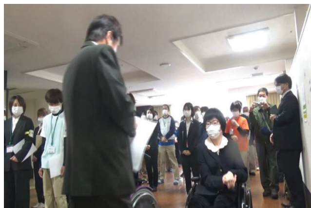
入社式の辞令交付。事業所への出勤はこの時のみ。