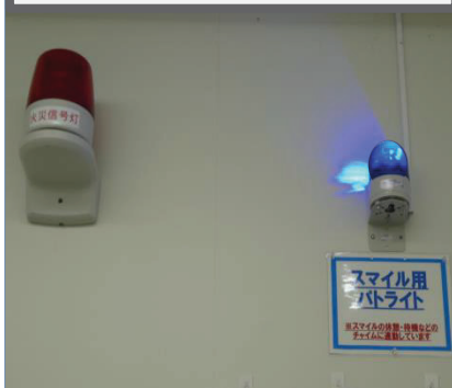
○視覚による伝達例 (回転灯)