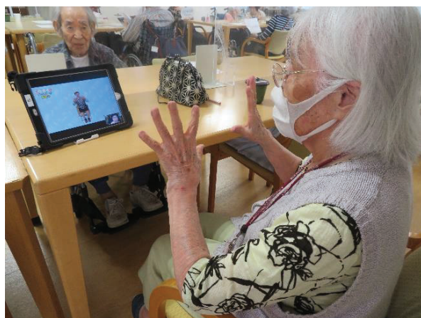
利用者の方が希望するリズム運動をタブレットで画面共有