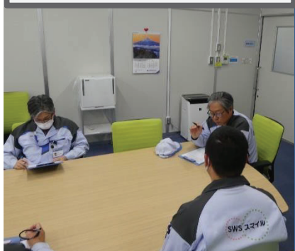
○定期・都度の面談 (定期面談の様子)