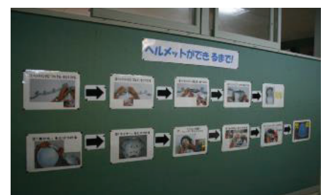
ヘルメットの製造工程を写真付きでわかりやすく表示