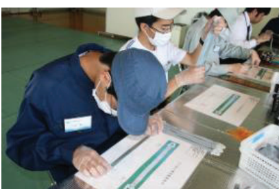
ヘルメット部品の寸法検査